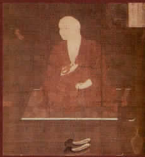
愛媛県指定文化財《弘法大師像》鎌倉時代 愛媛・本山寺