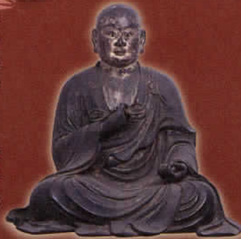
重要文化財《弘法大師坐像》鎌倉時代 奈良・元興寺

各札所をはじめ、金剛峯寺など関連の寺院等に伝わる貴重な文化財を中心に、愛媛大学との最新の共同調査で明らかにされつつある、へんろの歴史的展開や背景を示す多彩な資料など、国宝4件、重要文化財14件を含む約100件を紹介します。