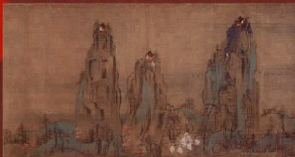
国宝《一瀝聖絵》巻二(部分) 鎌倉時代 正安元年(1298) 神奈川・清浄光寺(遊行寺) ※9/30~10/13展示