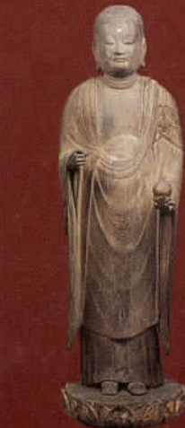
重要文化財《地蔵菩薩立像》平安時代 香川・善通寺