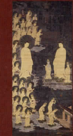
重要文化財《阿彌陀如来聖観音菩薩聖像》鎌倉時代 徳島・豊辺寺 ※9/23~10/13展示