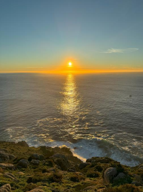
フィニステラの夕日

また、会場内では四国遍路に行かずとも同様の功德が得られるという「お砂踏み」を四国八十八ヶ所霊場会のご協力を得て、開催します。