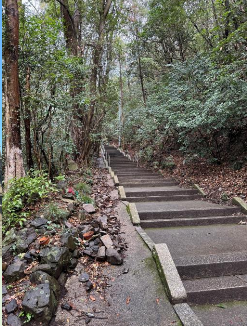
第71番札所弥陀谷寺の境内