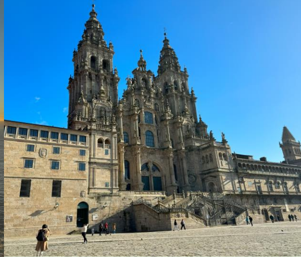
サンティアゴ・デ・コンポステーラ大聖堂